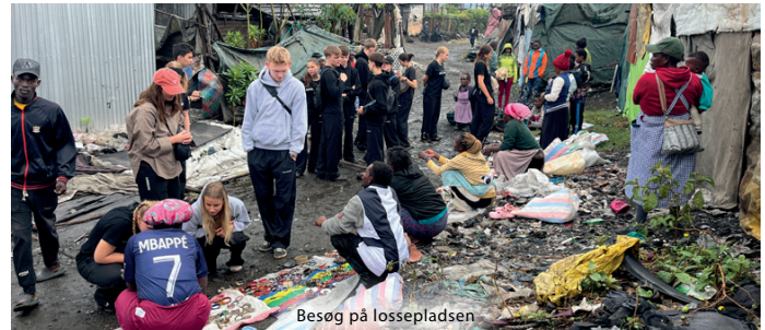
Besøg på lossepladsen

Vi har også bidraget med drama og klovnestykker om venskab, håb og tro. Det var stærkt at mærke, hvordan budskaberne blev taget imod med åbenhed og glæde. Derudover deltog vi til deres kulturdag, hvor vi fik indblik i en af stammernes traditioner og livsformer. Det var en