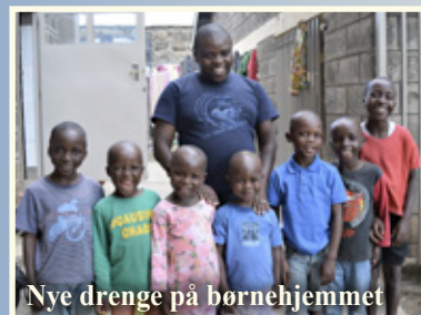
Nye drenge på børnehjemmet

Der er for tiden 64 drenge, som har deres hjem på drengenes børnehjem. 40 af drengene går i NLAI-skolen og bor hver dag på børnehjemmet. 12 større drenge fra børnehjemmet går på gymnasium, og er kun hjemme på børnehjemmet i ferien, men de har været