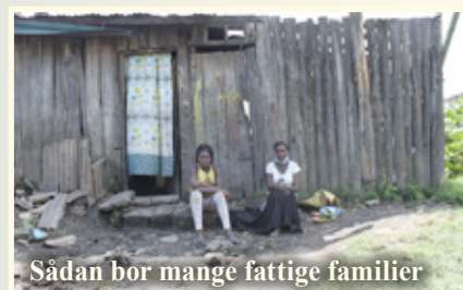
Sådan bor mange fattige familier

I mange af de familier, vi hjælper, har de fleste voksne kun daglejerarbejde, hvis de overhovedet har arbejde. Mange har mistet deres arbejde på grund af Corona og er efterhånden desperate efter blot at kunne få mad. Vi ved, at en endnu større byrde nu er blevet lagt på de fattige familier, da deres børn heller ikke kan komme i skole og få mad der længere.