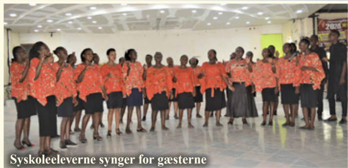
Syskoleeleverne synger for gæsterne