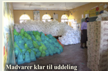
Madvarer klar til uddeling

Du kan være med til at give ved at indbetale et beløb øremærket "NLAI, akut hjælp" og sende det til vores danske missionskonto: Reg. nr. 9712 Konto nr. 0741793075, eller på Færøerne: Reg. nr. 6460 Konto nr. 0001759002