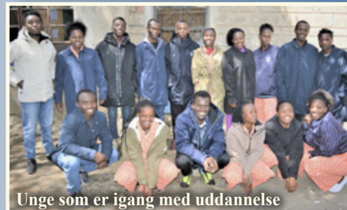
Unge som er igang med uddannelse

de er vokset på alle måder i deres liv, ikke kun fysisk men også mentalt og åndeligt, giver stor grund til at takke Gud for hver enkelt af dem. Deres liv så ud til at skulle mislykkes, men ved Guds nåde er de i dag unge, som kan stå med troen i deres hjerter og være klar til at komme videre i livet. Tusind tak til alle, som beder for dem og løfter økonomisk. Det er fantastisk, og vi er dybt taknemmelig.