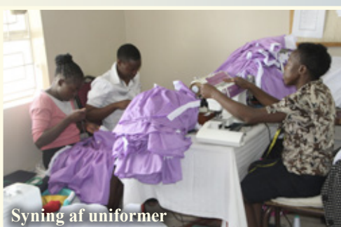
Syning af uniformer

Der var også mange samlinger på børnehjemmet og i skoleklasserne samt samlinger med de unge, som er i gang med uddannelse. Det giver nyt håb at sidde og lytte til deres historier om, hvordan de for mange år siden kom til NLAI, og nu er mange færdige med skole og gymnasium og i gang med uddannelse af forskellige slags. At høre og se, hvad troen betyder for dem, og at se, hvordan