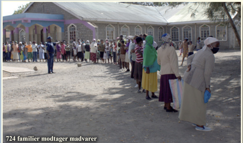
724 familier modtager madvarer

Og 23 elever er startet på forskellige gymnasier i januar 2020 ved hjælp af fadderskaber igennem NLAI.