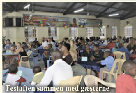
Festaften sammen med gæsterne

Mens min søster og jeg var der i februar, talte vi 50 forskellige gæster, så der var nok at hilse på, ud over at være hos børnene og personalet. Der var også volontører fra DK og fra Færøerne.