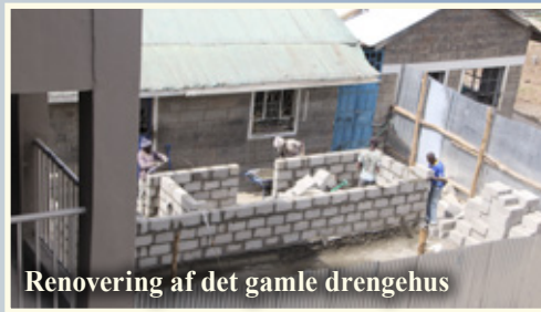
Renovering af det gamle drenges hus

Vi samler stadig midler ind til dette store projekt, så hvis du er interesseret i at støtte netop denne renovering kan du mærke din indbetaling: "Pigehus" .