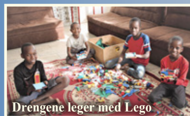
Drengene leger med Lego

på børnehjemmet under Corona-krisen. 12 andre af drengene fra børnehjemmet er voksne og i gang med uddannelse, så de bor på kollegium, hvor NLAI betaler deres udgifter.