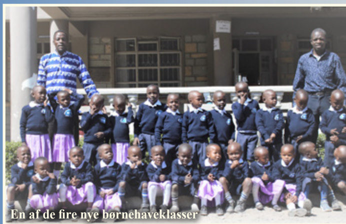
En af de fire nye børnehaveklasser

103 nye små elever er i år startet i børnehaveklasserne på NLAI-skolen og NLAI Tumaini-skolen.