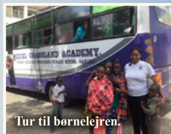
Tur til børnelejr