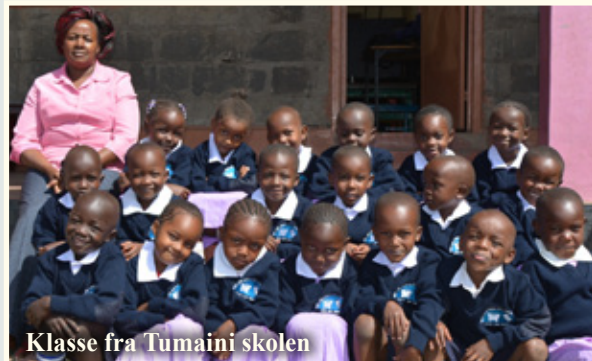
Klasse fra Tumaini skolen

der 64 elever dagligt, som også får undervisning, uniformer, sko, mad og omsorg. En af pigerne på skolen havde problemer med