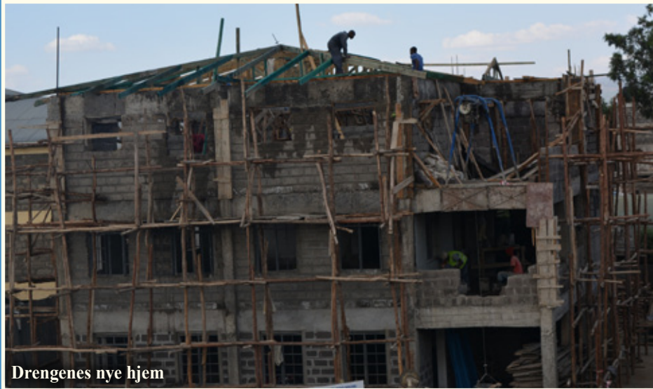
Drengenes nye hjem

Det går godt fremad med byggeriet, og snart er taget lagt på drengenes nye hjem. Murene er oppe, vinduer er sat i, gulve er lagt, og fliser er ved at blive sat op i badeværelser og opholdsrum. Drengene følger vældig med i, hvordan det går og glæder sig til den dag, de kan flytte ind i deres nye hjem. Huset bliver hjem for de 44 drenge, som bor på børnehjemmet nu, men der bliver samtidig en åben dør for ca. 40 andre drenge, som får muligheden for at få et nyt hjem. Dette hjem vil blive til stor hjælp og velsignelse for utallige drenge i fremtiden, som med stor taknemmelighed vil tænke på alle jer fra forskellige lande, der har givet penge til det. Tusind tak for jeres store hjælp. Selv om vi har samlet meget ind, skal der dog stadig bruges flere penge til de sidste ting.