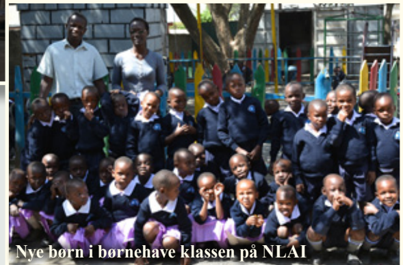
Nye børn i børnehave klassen på NLAI

24 små børn i baby klassen på NLAI skolen, samt 15 små børn på Tumaini baby klassen mangler hjælp til fadderskab. Du kan hjælpe med fadderskab på 360 kr. eller et delt fadderskab på 190 kr. pr. måned. Du er også meget velkommen til at dele dette behov med dine venner, så vi kan hjælpe disse skønne børn til at få dækket deres udgifter til skolen. En person kan ikke hjælpe alle, men alle kan hjælpe en til en god og betydningsfuld fremtid.