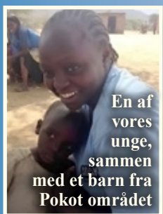
En af vores unge, sammen med et barn fra Pokot området

Senere i december, som er feriemåned for skolerne herude,