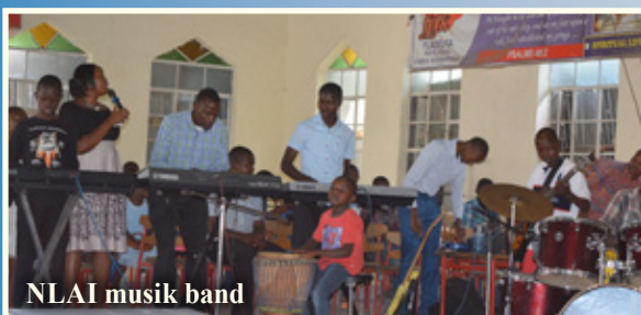
NLAI musik band

NLAI-skolekor gør store fremskridt, og det glæder os alle at lytte til deres sang. De synger også sammen med NLAI Band, musikgruppen som består hovedsageligt af drenge fra børnehjemmet, som er blevet så dygtige og spiller til mange arrangementer, både i skolen og i kirken.