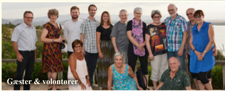
Gæster & volontører