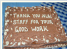
Tak til vores dygtige personale

Vi vil takke vores dygtige personale for deres store hengivenhed i arbejdet med børn og unge. Det er ikke altid lige let, da det kan være svært at lytte til de mange barske og frygtelig dramatiske historier fra børnene. De prøver virkelig at rumme og favne de kære børn, som behøver dem i hverdagen.