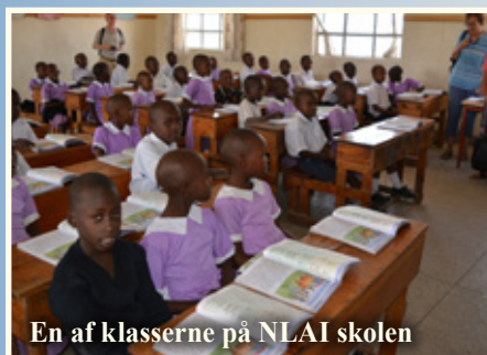
En af klasserne på NLAI skolen

Mange børn er kommet til skolen, hvor der var ekstra plads i klasserne, ud over de 2 nye børnehaveklasser. Alle er blevet fotograferet, så billeder bliver sendt til dem, som er fadder for et barn, i løbet af de næste måneder.