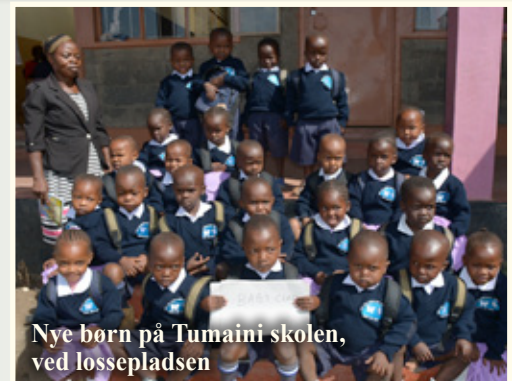
Nye børn på Tumaini skolen, ved lossepladsen