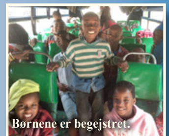
Børnene er begejstret.

De små børn var på lejr i december, hvor de havde en rigtig god og hyggelig tid sammen med personalet, som var med dem. De besøgte også et andet børnehjem og opmuntrede dem, samt legede og nød at være i nye omgivelser. Der er nu 103 børn på børnehjemmet,