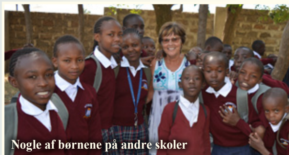
Nogle af børnene på andre skoler

Vi har 131 elever på skoler uden for NLAI skolen, som bliver støttet igennem NLAI i folkeskolen, som alle får undervisning, uniformer, tasker, mad og hvad de har brug for. Nogle af børnene fra skolen i byen går på kostskole, da det er for risikabelt for dem at bo hjemme på lossepladsen.