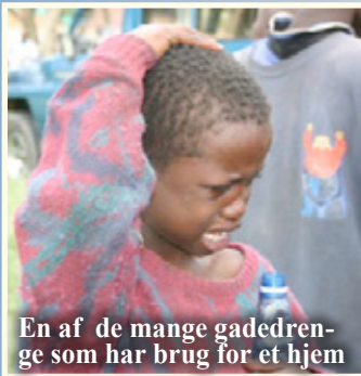
En af de mange gadedrenge som har brug for et hjem

Det går godt fremad med byggeriet, og snart er taget lagt på drengenes nye hjem. Murene er oppe, vinduer er sat i, gulve er lagt, og fliser er ved at blive sat op i badeværelser og opholdsrum. Drengene følger vældig med i, hvordan det går og glæder sig til den dag, de kan flytte ind i deres nye hjem. Huset bliver hjem for de 44 drenge, som bor på børnehjemmet nu, men der bliver samtidig en åben dør for ca. 40 andre drenge, som får muligheden for at få et nyt hjem. Dette hjem vil blive til stor hjælp og velsignelse for utallige drenge i fremtiden, som med stor taknemmelighed vil tænke på alle jer fra forskellige lande, der har givet penge til det. Tusind tak for jeres store hjælp. Selv om vi har samlet meget ind, skal der dog stadig bruges flere penge til de sidste ting.