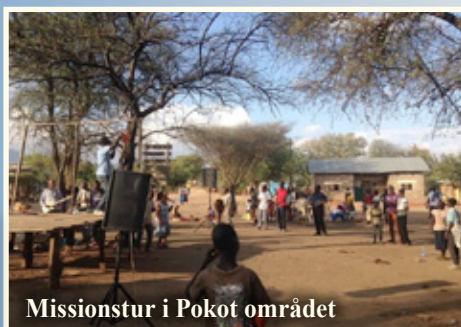
Missionstur i Pokot området

var de unge fra NLAI også med på missionstur til Pokot, som er et ret isoleret område. Her var de involveret i mange opgaver. De deltog med sang og vidnesbyrd og hjalp til, hvor der ellers var brug for det, og lærte om mission.