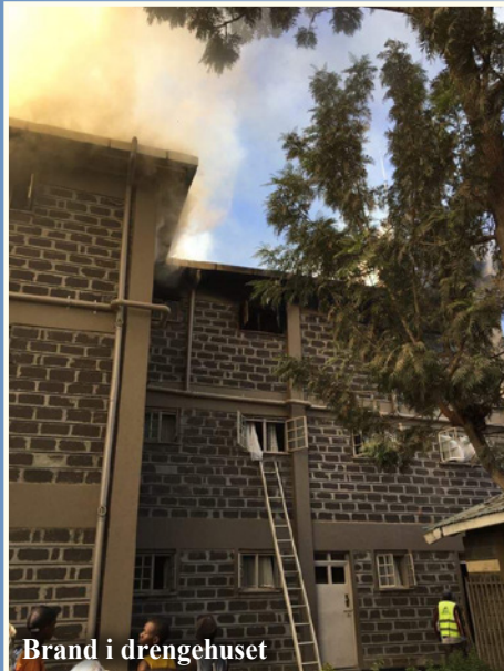
Brand i drengehuset