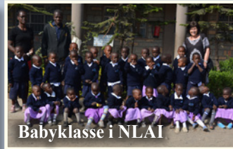
Babyklasse i NLAI