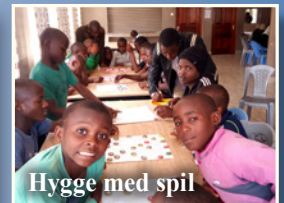
Hygge med spil