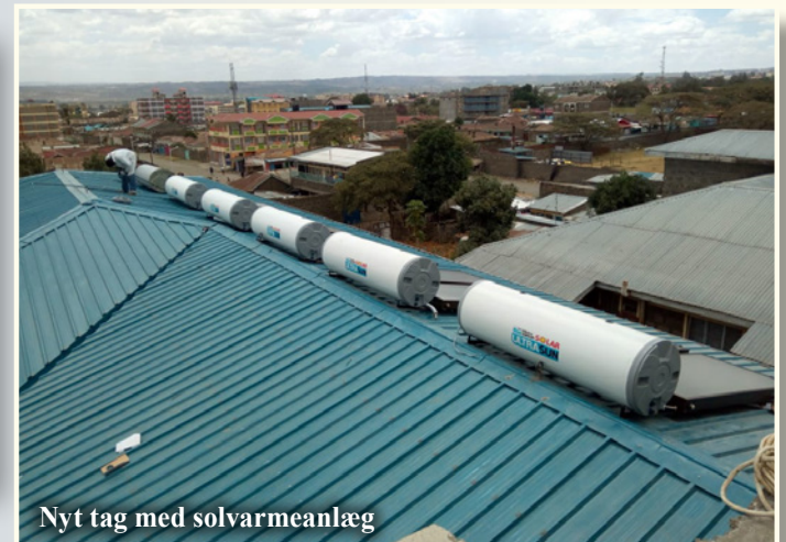
Nyt tag med solvarmeanlæg