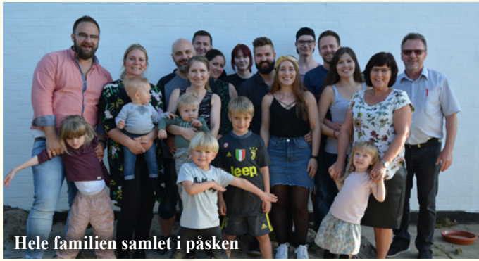
Hele familien samlet i påsken