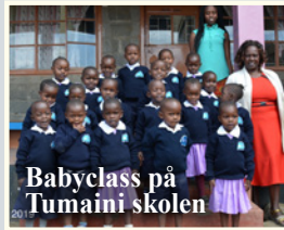
Babyclass på Tumaini skolen

I begyndelsen af januar hvert år starter ca. 55 nye elever på de 2 NLAI skoler. Flere og flere fortsætter videre i gymnasiet og videregående uddannelser, så vi mangler hele tiden nye sponsorer / faddere for børnene. Dette år er 24 nye elever startet på gymnasiet, så NLAI for tiden betaler for 97 elever på gymnasier.